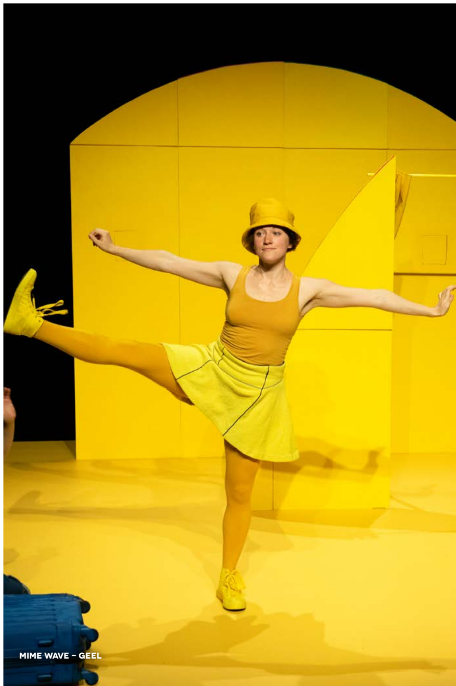
MIME WAVE - GEEL