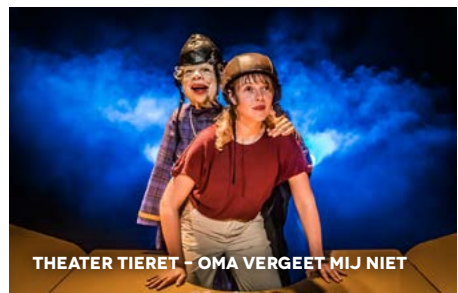
THEATER TIERET - OMA VERGEET MIJ NIET