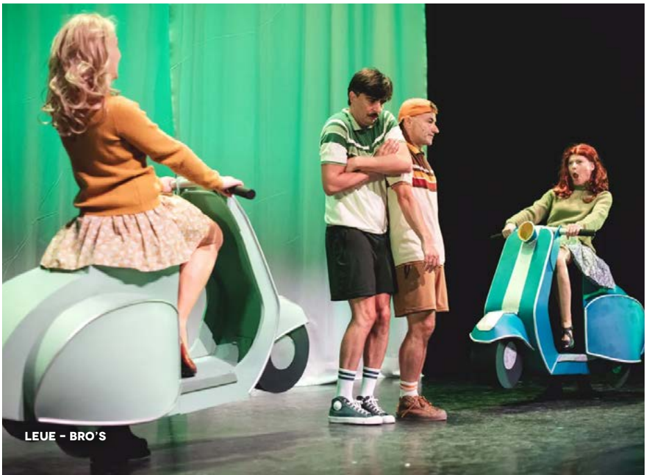
LEUE - BRO'S