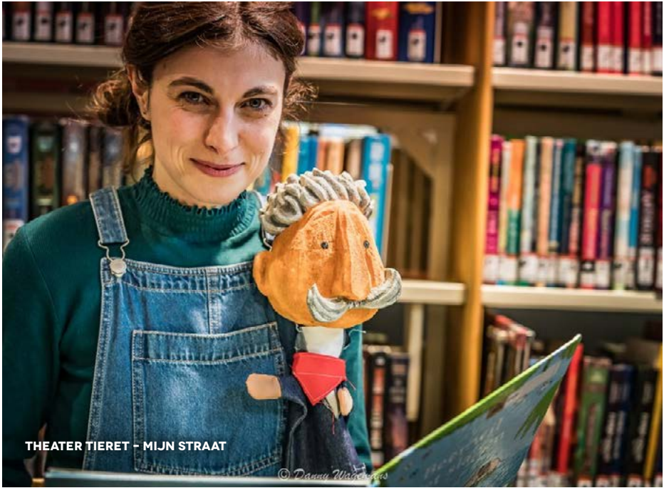
THEATER TIERET - MIJN STRAAT