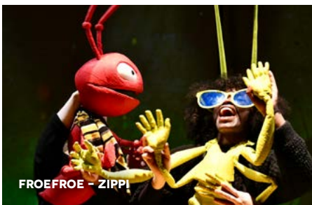
FROEFROE - ZIPPI

Ma 18 november (optie om 14 uur) en di 19 november (10 + 14 uur) | CC Guldenberg | Duur: 50 minuten | Max. 200 per voorstelling